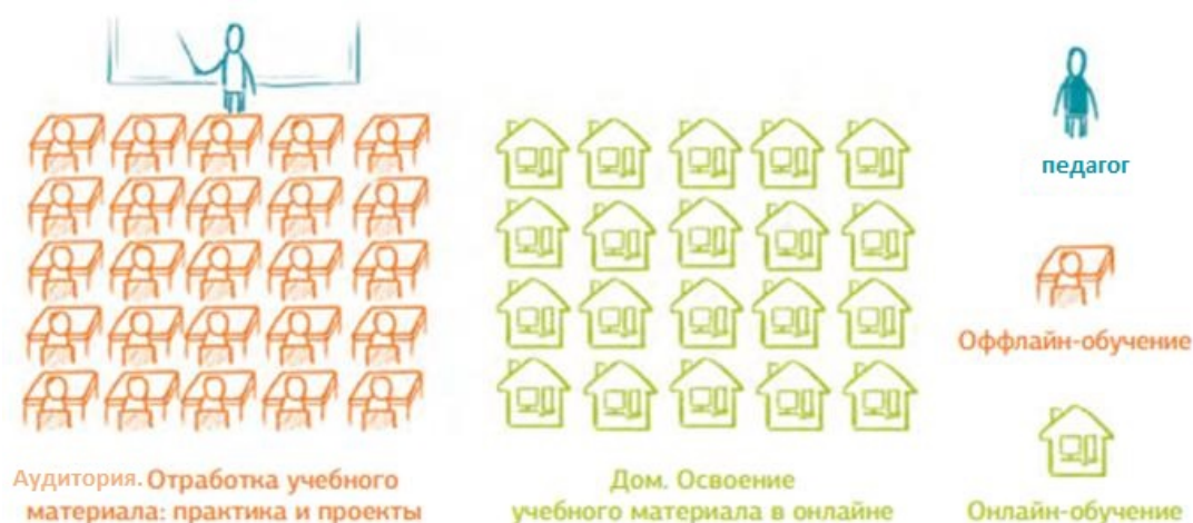
Рис.1 Модель «Перевернутый класс»

Дистанционное обучение используется только в модели «перевернутый класс» (рис.1).