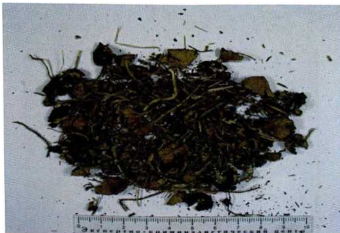
Рисунок 11. Грибы в засушенном виде

ЛСД - диэтиламид лизергиновой кислоты - синтетический галлюциногенный наркотик. Как правило, данным наркотиком пропитываются листки бумаги или картона, именуемые «марками». Способ употребления - рассасывание в полости рта.