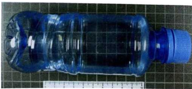
Рисунок 8. 4-гидроксibuтират натрия

4-гидроксibuтират натрия, 1,4-бутиандион, гаммабутиролактон - психотропные вещества синтетического происхождения. Встречается в виде прозрачной жидкости. Основной способ употребления - как с напитками, так и в чистом виде.