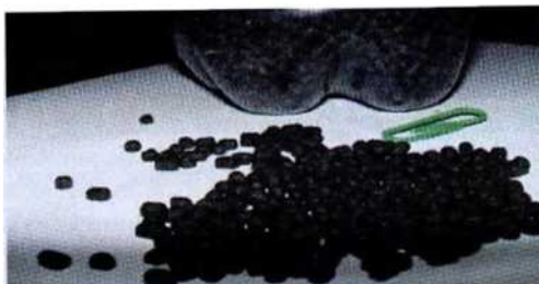
Рисунок 14. Насвай

Насвай - никотиносодержащий продукт, традиционный для Центральной Азии. Наркотиком не является. Основной составляющей насвая является табак или махорка, вместо которой ранее использовалось местное растение «нас». В насвай входят пепел льна или других растений, гашёная известь, куриный помёт и кизяк, а также растительное масло и другие компоненты.