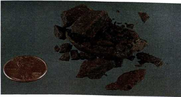
Рисунок 4. Гашиш

Гашиш - собранная с волосковых желёз конопли и высушенная смола, похожая на пластилин. Встречается в виде колбасок, лепёшек, плоских кружков или брикетов. Цвет - от чёрного до различных оттенков коричневого, серовато-зелёного и зелёного.