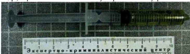
Рисунок 2. Шприц с дезоморфином

Дезоморфин - кустарно изготавливаемый из кодеинсодержащих лекарственных препаратов (коделак, пенталгин, пиралгин, седалгин-м, седалгин-нео, терпинкод, тетралгин и др.) наркотик. Основной способ употребления - внутривенные инъекции.