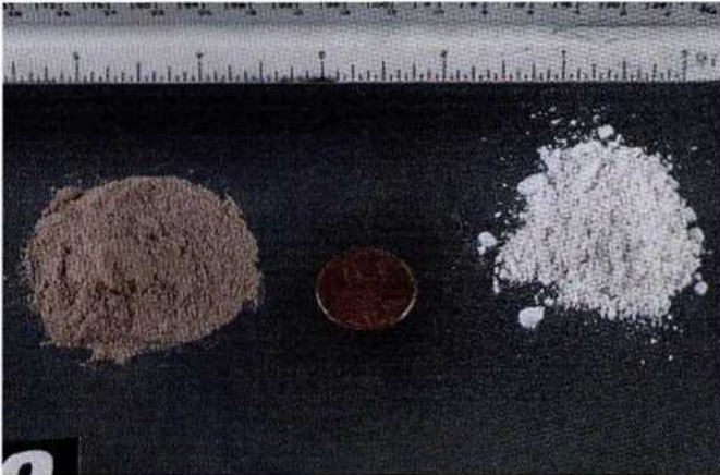
Рисунок 6. Кокаин

Кокаин - психостимулятор, изготавливаемый из листьев растения Кока. Чаще встречается в виде белого кристаллического порошка. Кокаин может использоваться путём инъекций, вдыхания, глотания и курения. Основной способ употребления - вдыхание через трубку в нос.