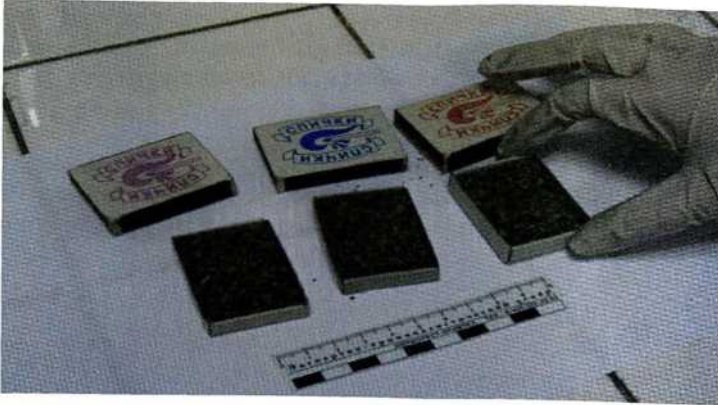
Рисунок 3. Марихуана

Гашиш - собранная с волосковых желёз конопли и высушенная смола, похожая на пластилин. Встречается в виде колбасок, лепёшек, плоских кружков или брикетов. Цвет - от чёрного до различных оттенков коричневого, серовато-зелёного и зелёного.