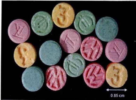
Рисунок 9. «Экстази»

Псилоцин и псилоцибин - галлюциногены растительного происхождения, содержатся в грибах-поганках. Иногда грибы выращивают в домашних условиях. Основной способ употребления - в виде маленьких кусочков свежих или высушенных грибов.