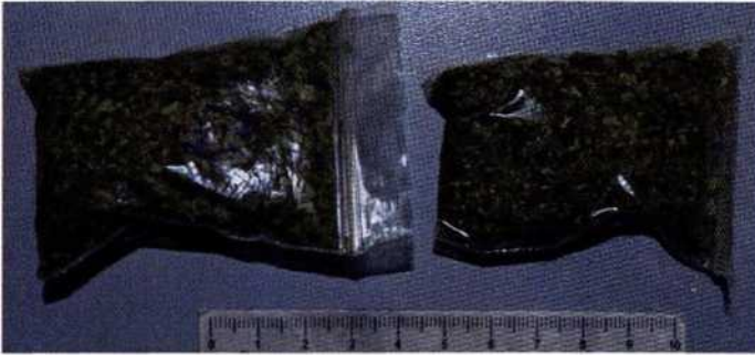
Рисунок 5. Курительная смесь

Кокаин - психостимулятор, изготавливаемый из листьев растения Кока. Чаще встречается в виде белого кристаллического порошка. Кокаин может использоваться путём инъекций, вдыхания, глотания и курения. Основной способ употребления - вдыхание через трубку в нос.