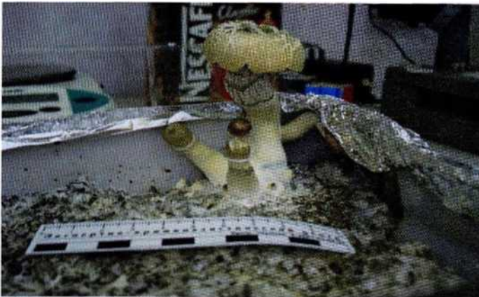
Рисунок 10. Гриб, выращенный в домашних условиях

Псилоцин и псилоцибин - галлюциногены растительного происхождения, содержатся в грибах-поганках. Иногда грибы выращивают в домашних условиях. Основной способ употребления - в виде маленьких кусочков свежих или высушенных грибов.